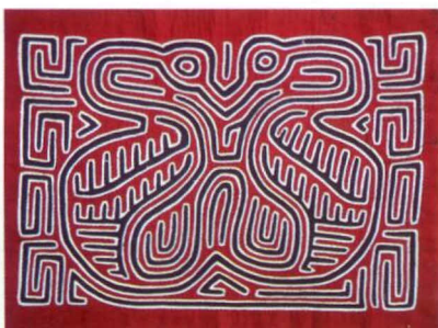
Sikwi Mor – Molas, in denen das Motiv in geometrischen Designs verschwindet, waren vor allem in den 1960er Jahren populär.

Zwei Vögel, die einander zugewandt sind. Derartige Molas symbolisieren die Liebe zwischen zwei Menschen und werden oft von den Frauen des Dorfes bei einer Hochzeitszeremonie getragen.