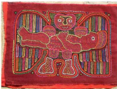
Seelenvogel, der einen Verstorbenen in die nächste Ebene begleitet.

Vögel haben in der Tradition der Kuna eine ähnliche Bedeutung wie „Schutzengel“ in der christlichen Religion. Jedem Neugeborenen spricht der Schamane des Stammes einen „Seelenvogel“ zu. Das kann ein Papagei, ein Pelikan, ein Kolibri, ein Hahn, etc. sein. Dieser Seelenvogel begleitet den Menschen durch das ganze Leben.